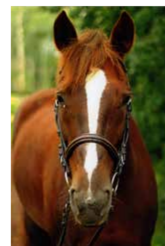
Alice, född 1998, till Sleipner 1999, sto, fux, welsh cob/ svenskt halvblod. Fortfarande i verksamheten på Sleipner.