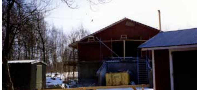
I mars 1993 var huset på plats, och man hade börjat med körbron upp på loftet.