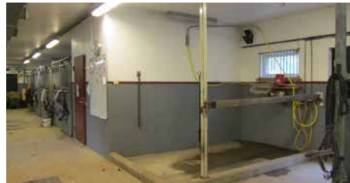
I vattenspiltan kan man ställa upp hästen och spola av den.