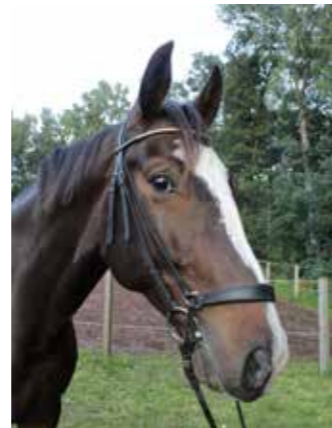
Debro, född 2008, till Sleipner 2015, valack, holländskt halvblod. Stor, snäll häst som tar rejäla kliv.