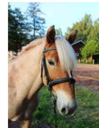
Seselis "Olle", född 2009, till Sleipner 2016, valack, lettisk ponnykorsning. Ser ut som en riktig sagohäst med sin ljusa man och svans. Han är en suverän barnponny med lagom framåtjudning.