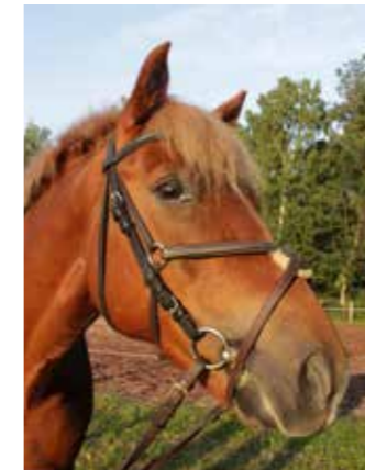
Stenhaga Gellon "Gellon", född 2009, till Sleipner 2014, valack, New Forest. Köptes in som 5-åring och är en mycket duktig ponny. Han vill dock vara ifred i spiltan och föredrar att bli borstad i skoningsrummet.