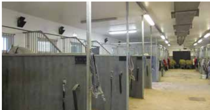
Åtta boxar och åtta spiltor finns det i det nya stallet.