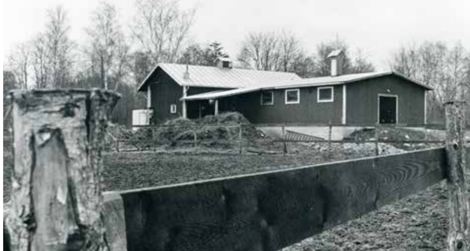
När ridklubben flyttade in fanns bara plats för fyra hästar i stallet, men vinkeln som efter några år byggdes på söderut gav plats åt betydligt fler hästar.