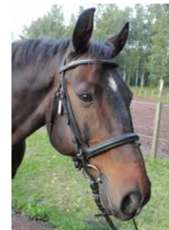
Ready to Fly "Flugan", född 1999, till Sleipner 2009, valack, svenskt halvblod. Han är en väldigt användbar häst som rids av både små barn och vuxna.