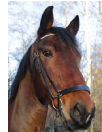
Big Indian "Indianen", född 2006, till Sleipner 2010, valack, pinto. Köptes in redan som 4 åring och visade sig vara ett väldigt lyckat köp. Han är stor och ståtlig och duktig både i hoppning och dressyr.