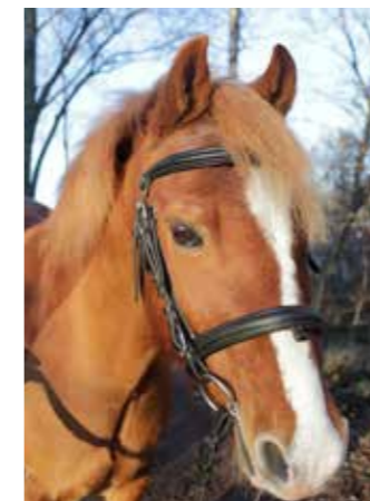
Glyncoch Mr Jones "Jossi", född 2005, till Sleipner 2014, valack, Welsh. Har bara ett öga efter en skada 2011. Han är söt som socker och en liten latmask som ryttarna får kämpa lite extra för att övertyga om att han ska snabba på lite.