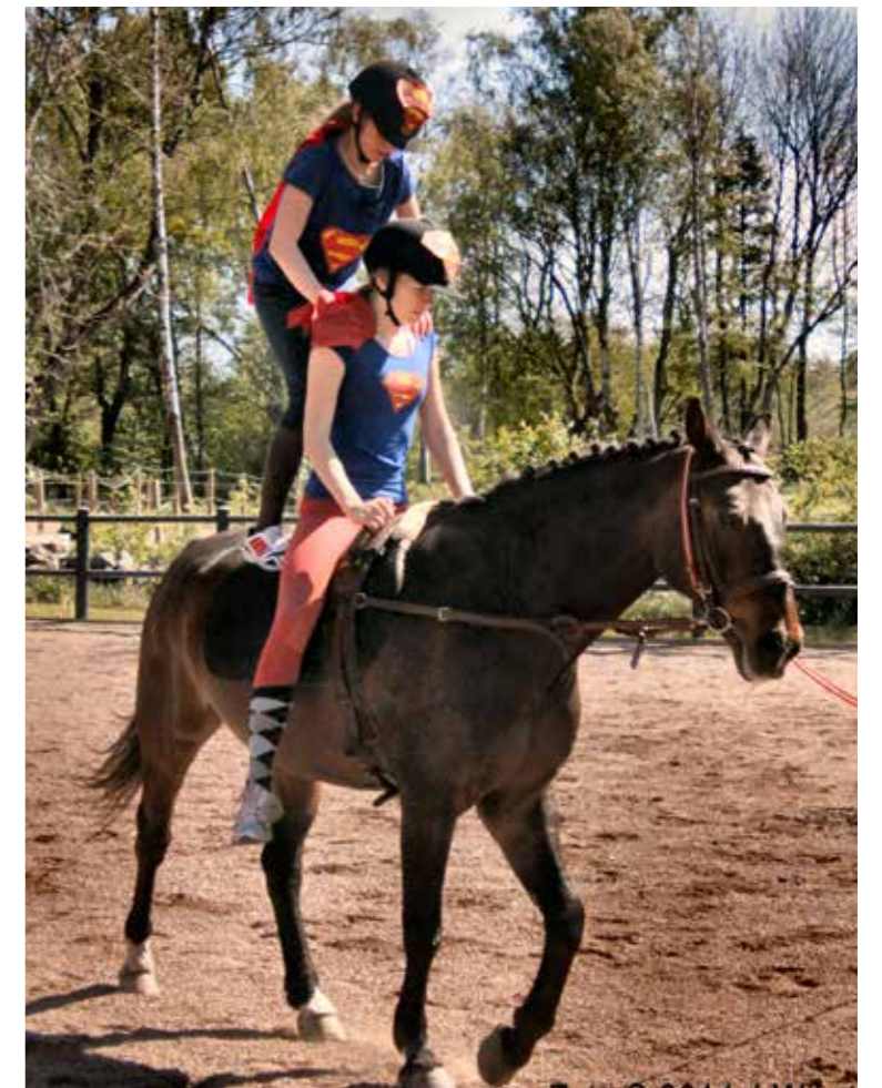
Uppvisning under vårfesten 2014.

Det har skett stora nedskärningar i ungdomsverksamheten i stan, både Tvärsan och Tärnan är nedlagda, och idag finns bara Uncan på Stora Gatan kvar inne i stan, och så förstås Stallet på Sleipner. □