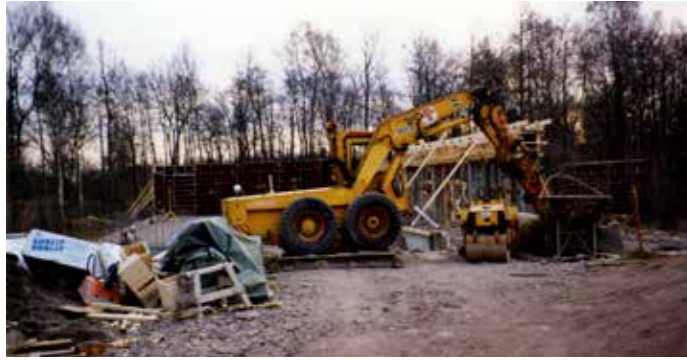
Bestutet om finansieringen togs av staden i budgetbehandlingen i november 1992, byggplanerna räknades ned, och i februari 1993 hade man redan grävmaskinen på plats.