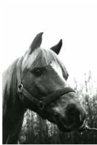
Hamlet, född 1966, till Sleipner 1972, valack, welsh pony, såld till Berit Österlund i Geta 1978. Sleipners första egna häst.