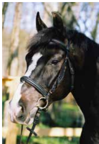
Indeed, född 1980, till Sleipner 1987, valack, mörkbrun m vita strumpor, svenskt halvblod, såld 1999 till Rebecka Eriksson.