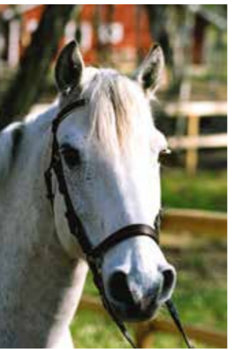
Anthrax - Ante, född 1984, till Sleipner 1990, valack, skimmel, connemara, såld 2001 till Nadja Jansén.