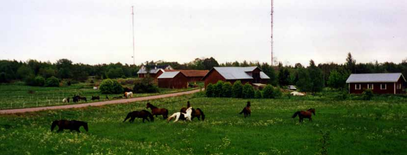
Hästarna på sommarbete på Järsö.