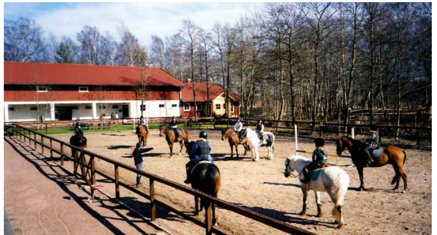
När vädret tillåter hålls ridlektionerna gärna utomhus på någon av de två utebanorna.

Sleipner, akrobatik på hästryggen, men det är inget man sysslat med på många år nu. För det behöver man både en häst som klarar styrkemässigt och mentalt att ha ett antal flickor som hoppar upp, står på händer på hästryggen och även är flera på hästryggen samtidigt, och att detta sker i galopp. Och idag har vi inte haft någon