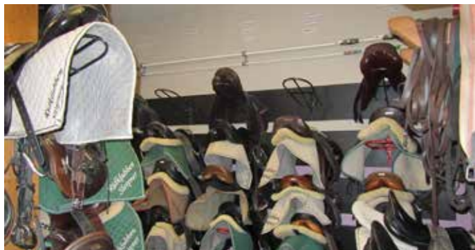
Alla hästar på Slepner har sin egen sadel, och en del har t.o.m. skilda dressyr- och hopp saddlar, och för det finns det ett särskilt rum-sadelkammaren.