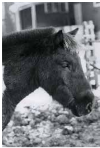
Skjóna fra Hvoli, född 1972, till Sleipner 1979, sto, skäck, islandshäst. Fick fölet Juni den 1 juni 1980. Söld 1993 till Catrin Schönberg.