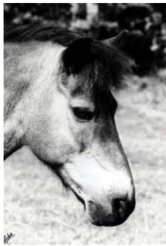
Ofelle - Offe, född 1974, till Sleipner 1979, valack, brun med ål, gotlandsruss såld 1993 till Nagu.