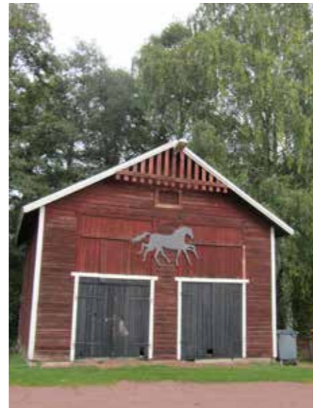
Den enda gamla byggnaden på Sleipner är redskapsboden vid parkeringen. Den finns på fotografier från Nygatan på 1920-talet – då som församlingens likvagnsskjul.

förrådet var tillgängligt och lättflyttat. När det flyttades hittade man gammal ammunition i grunden, troligen från andra världskriget. Det fyndet blev mycket omtalat i tidningarna. Och huset hade flyttats förr, det finns bilder på det från början av 1900-talet, då det stod på Nygatan strax väster om Bio Savoy. Då var det likvagnsskjul, med betydligt större portar än idag, och användes av Mariehamns församling.