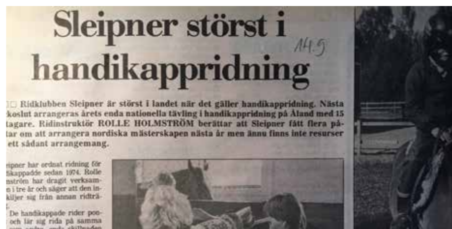
Under en tid på 1980-talet bedrev Sleipner landets bästa handikappridning. Tidningsklippet är från 1985.