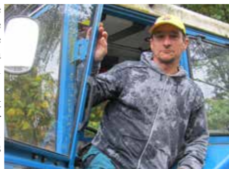
En av Florians alla arbetsuppgifter är att köra traktor och harva ridbanorna.

Det bästa med att jobba på Sleipner är att det finns så många fina hästar här, säger han och tillägger att han älskar djur. Och att jobba med djur är som en slags terapi - det motverkar stress, säger han.