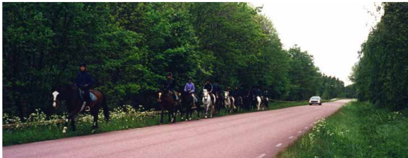
Sleipner är omgivet av bilvägar i dag, och har ont om ställen att rida ut på, men ett exploaterat Svinö holme kan innebära att det skapas ridvägar i rekreativ området där.

Det vet jag av egen erfarenhet när det gäller hundar och katter, och naturligtvis förstår jag också den starka kärlek som utvecklas mellan människor och ett så stort djur som en häst. ☐