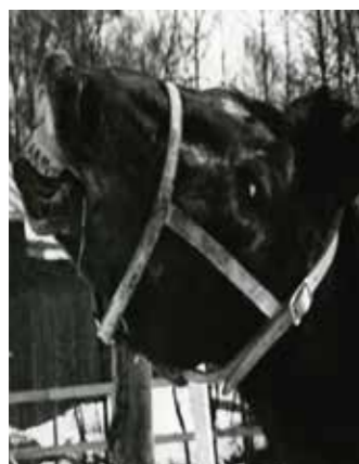
Romeo, född 1969, till Sleipner 1973, valack, tigrerad, knabstrupper, såld tillbaka till Sverige 1974. Avkastarkung.