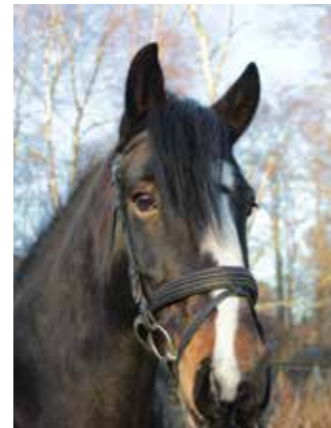
Eddies Lad "Eddie", född 2011, till Sleipner 2017, valack, irish cob. En lite känslig unghäst till en början. Han växer nu in i ridskolerollen alltmer. Han är väldigt snäll och vi hoppas att han ska trivas länge hos oss.