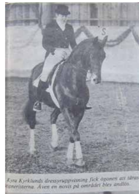
Den finländska OS-ryttaren Kyra Kyrklund red en uppvisning i dressyr som en del av invigningsprogrammet i det nya ridhuset. Här ett klipp ur Nya Åland från den 15 april 1985