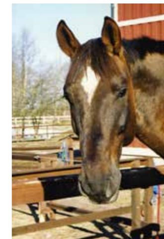
Baloo, född 1992, till Sleipner 2000, valack, svettfux, holländskt halvblod, såld 2009 till familjen Öhman.