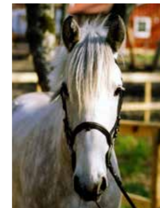
Ivory "Ior", född 1993, till Sleipner 1998, valack, Highland ponny. Otaliga barn har startat sin ryttarkarriär på honom och också tuggat grus efter en klassisk "Ior": tvärnit och vika åt sidan samtidigt. Blev pensionär efter 20 år i december 2017.