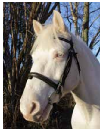
Abbe Truelight Sinatra "Abbe", född 2007, till Sleipner 2015, valack, albino, connemara. En snäll och stabil ponny som både barn och vuxna kan rida.