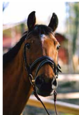
Orion, född 1984, till Sleipner 1991, valack, brun, svenskt halvblod. Kom med Landå från Skåne, och såldes 2001 till Anja Karlsson och Tony Nordlund.