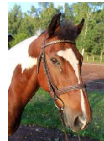
Texas, född 2001, till Sleipner 2015, valack, korsningsponny. Blev alla barnens favorit redan från första stund. Han är en pigg och glad ponny som tycker om att hoppa.