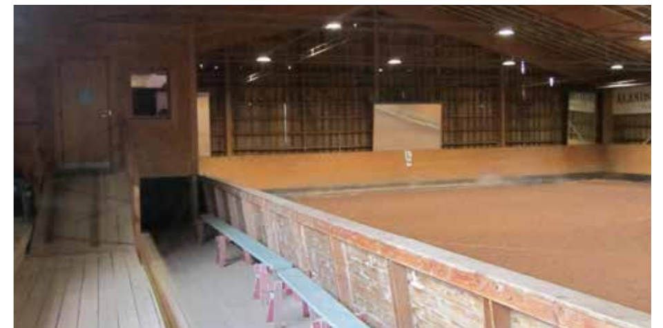
Värmerummet i västra delen av läktaren i ridhuset isolerades och inreddes så småningom, och fungerade först som mötesrum, senare som sovsal under ridläger