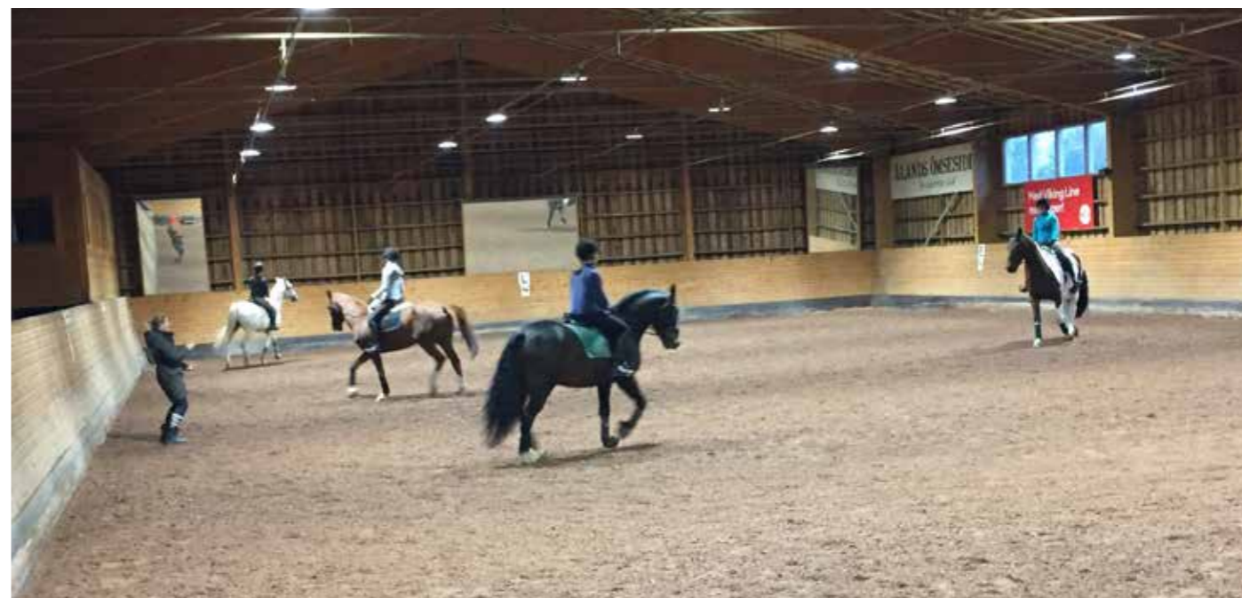
Nu finns det en särskild tävlingsgrupp på Sleipner så att även ryttare utan egen häst ska kunna lyckas bättre när de tävlar.