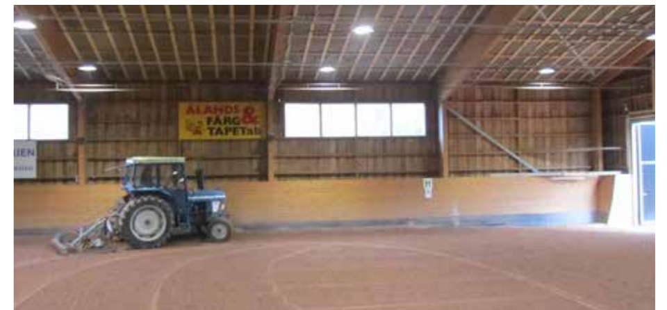
Tre dagar i veckan harvas ridunderlaget i ridhuset.