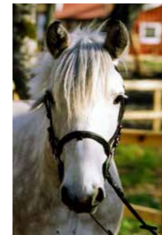
Ivory, född 1993, till Sleipner 1997, valack, brunskimmel, highland pony. Pensionerad i december 2017 efter 20 år.