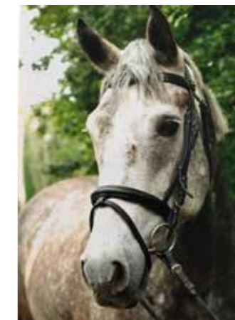
Pain Killer "Killen", född 2006, till Sleipner 2011, valack, estnisk korsning. Köpt på Åland fast han ursprungligen kommer från Estland. Avled hastigt och oväntat i mitten av december 2017 i kolik.