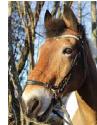
Samson, född 1995, till Sleipner 2008, valack, danskt halvblod. Köptes då ridsklubben behövde en lite äldre häst som kunde gå direkt in i verksamheten. Han har varit en riktig klippa fast han på äldre dar vill vara i fred i sin box.