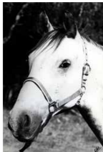
StreetBoy, född 1982, till Sleipner 1989, valack, skimmel, danskt halvblod, såld 1999 till Sven Löfström.