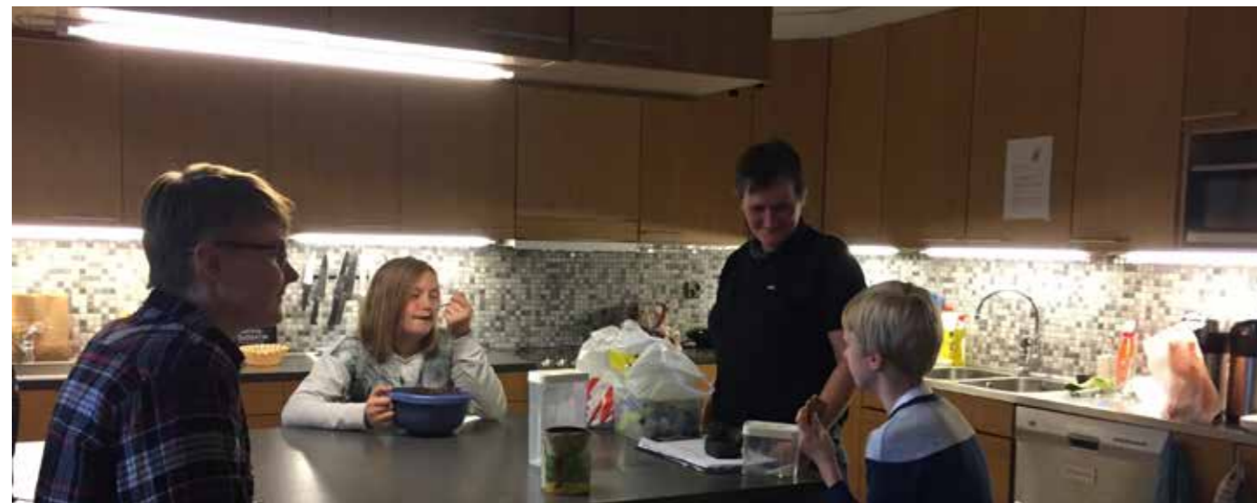
Behöver man hjälp finns alltid Mio till hands om man vill fixa sig ett mellanmål, men målet är att man ska lära sig att göra det själv.