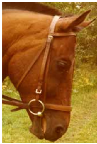
Othello, född 1969, till Sleipner 1973, valack, danskt halvblod, mörkbrun, död i hagen 1977.