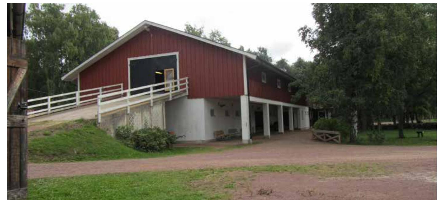
Det viktigaste kom med även i den bantade byggplanen – plats för 16 hästar och en ordentlig del med sociala utrymmen.

Sedan återvände hon till Åland och jobbet som busschaufför. Och så skaffade