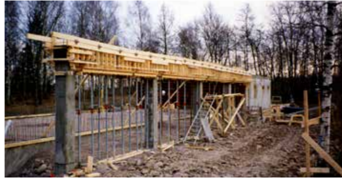
Väggarna i nya stallet är ordentligt armerade.