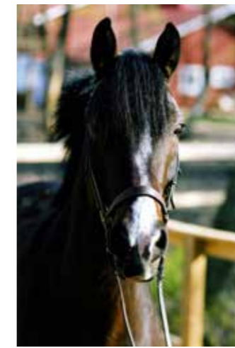
Stockmossens Kate, född 1987, till Sleipner 1997, sto, brun, connemara såld 2010 till Anki Lind.