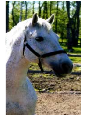
Kotimäenen Hans - Hasse, född 1997, till Sleipner 2005, valack, skimmel, cob, enögd. Togs bort 2016 bl a pga dåliga tänder.