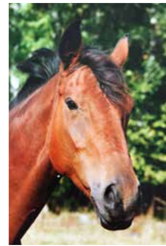
Emil, född 1985, till Sleipner 1993, valack, ljusbrun, svenskt halvblod. Tände och släckte lampor i stallet. Till slakt 2000.