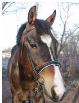
Browny, född 2008, till Sleipner 2016, valack, brun, holländsk ridponny. En kunnig ponny som gärna testar sina ryttere och provar om han kan välja sin egen väg.