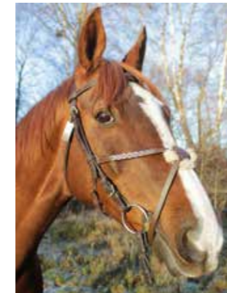
Saint Flori "Flora", född 2003, till Sleipner 2016, sto, tyskt halvblod Westfalen. Ett riktigt fuxsto ända ut i hovspetsarna. Hon lär sina ryttere att man inte får klämma med skänklarna då man rider.