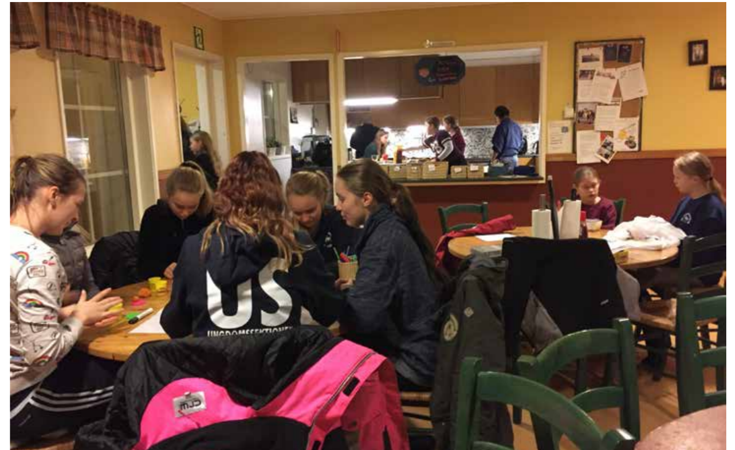
I köket pågår pepparkaksbak, medan några pysslar och andra lägger upp en hoppbana. På ungdomsgården Stallet kan man syssla med alla möjliga saker.

Under en period fanns det också ett system med sköthästar i stallet, och då gjordes det skötpärmar för de olika hästarna inom ramen för ungdomsgårdens verksamhet, så de som delade på en häst kunde läsa sig till vad de andra gjort hittills under en vecka. Men det blev lite mycket skavytor