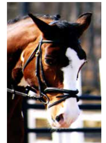
Hokus Pokus, född 1992, till Sleipner 2003, valack, skäck, svenskt halvblod. Gick i pension hos Ulrika Sundblom-Korpi 2015.