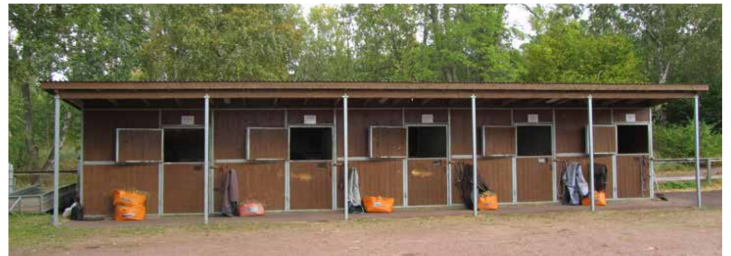
Uteboxarna är egentligen den enda byggnad på Sleipner som byggts av klubben och som fortfarande ägs av klubben. De var från början tänkta att bara finnas tillfälligt, men är idag – 15 år senare – oundgängliga i verksamheten.