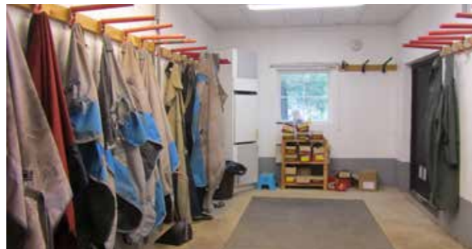
I anslutning till spiltorna finns skoningsrummet, som både används när hovslagaren kommer, när man vill ställa upp hästen för att pyssla med den, och som värme- och torkrum för blöta täcken.