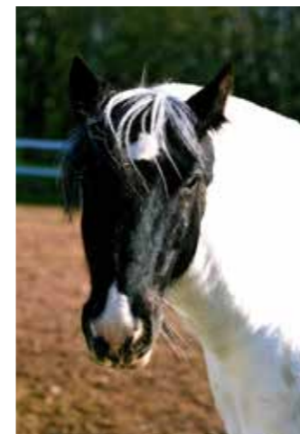
Cyril, född 1985, till Sleipner 1993, valack skäck, tinker, såld 2004 till Sandra Gustafsson.