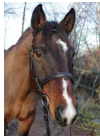
Stockmossens Ferrano "Ferrano", född 2000, till Sleipner 2008, valack, korsning connemara/halvblod. Stark och stabil med bekväma gångarter. Med sin raka kropp är han även en hejare på snabba svängar.