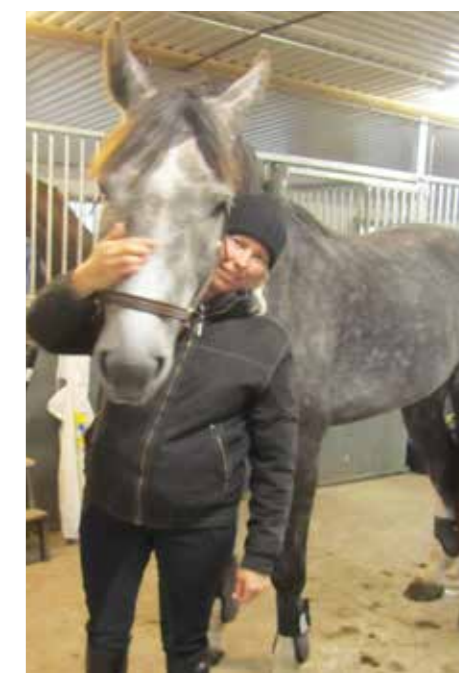
Cia tror att unghästen Galathea kommer att bli en riktigt bra hopphäst framöver.

Sleipner gav mig grunderna, och därifrån har jag gått vidare, säger hon. ☐